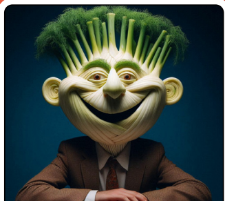
אין לו בכלל קשר להבטחה