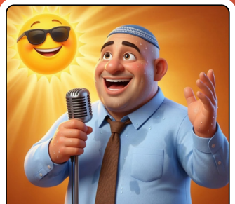
השיר הבא מוקדש לכם בחום