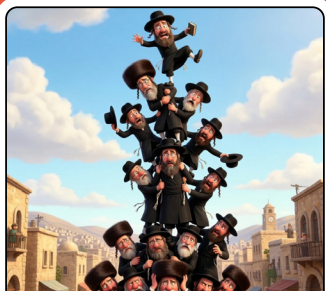
החלה מכירת מגדלי... הזקן