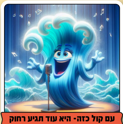
עם קול כזה - היא עוד תגיע רחוק