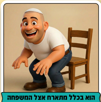
הוא בכלל מתארח אצל המשפחה