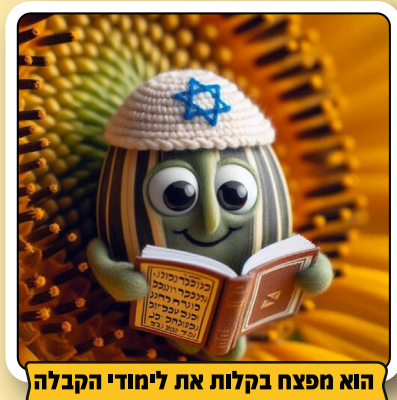
הוא מפצח בקלות את לימודי הקבלה