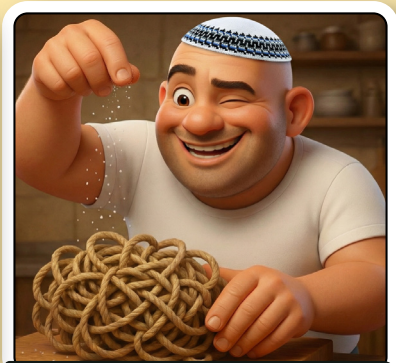
כנראה שבאמת אין שם קליטה