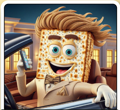
עבדתי קשה בשביל זה