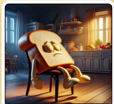
סוף סוף סיימתי את הנקיונות